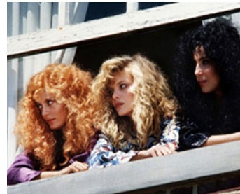
1987 LES SORCIÈRES D'EASTWICK (The Witches of Eastwick) de G. Miller avec S. Sarandon, Cher