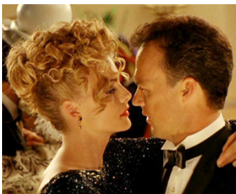
1992 BATMAN, LE DÉFI (Batman Returns) de Tim Burton avec Michael Keaton