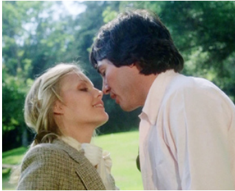
1981 CHARLIE CHAN AND THE CURSE OF THE DRAGON QUEEN de C. Donner avec R. Hatch