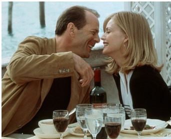
1999 UNE VIE À DEUX (The Story of Us) de Rob Reiner avec Bruce Willis