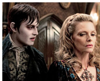
2012 DARK SHADOWS (Dark Shadows) de Tim Burton avec Johnny Depp