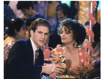
1988 VEUVE MAIS PAS TROP (Married to the Mob) de Jonathan Demme avec Matthew Modine