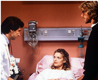
1987 HAMBURGER FILM SANDWICH (Amazon Women on the Moon) de J. Landis avec G. Dunne, P. Horton