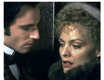
1993 LE TEMPS DE L'INNOCENCE (Age of Innocence) de M.Scorsese avec Daniel Day Lewis