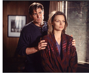
1999 AUSSI PROFOND QUE L'OcéAN (The Deep End of the Ocean) d'Ulu Grosbard avec Treat Williams