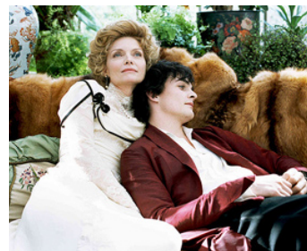
2009 CHÉRI (Chéri) de Stephen Frears avec Rupert Friend