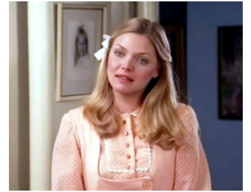
1980 FALLING IN LOVE AGAIN de Steven Paul