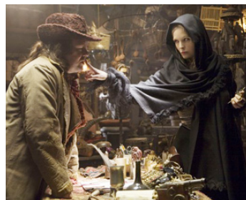
2007 STARDUST, LE MYSTÈRE DE L'ÉTOILE (Stardust) de Matthew Vaughn avec R. Gervais