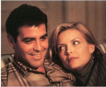
1996 UN BEAU JOUR (One Fine Day) de Michael Hoffman avec George Clooney