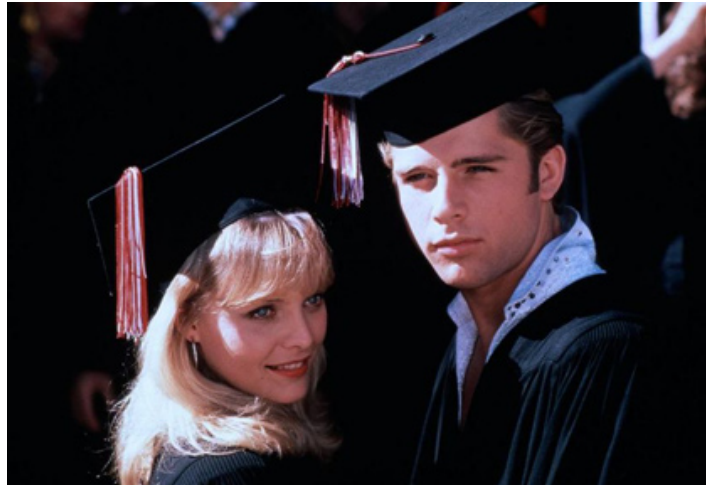
1982 GREASE 2 (Grease 2) de Patricia Birch avec Maxwell Caulfield