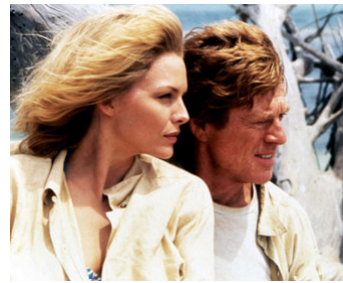
1996 PERSONNEL ET CONFIDENTIEL (Up close and Personal) de Jon Avnet avec R. Redford