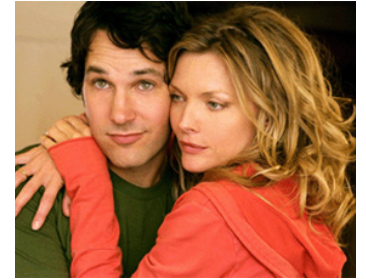
2007 TROP JEUNE POUR ELLE (I couln never be your Woman) d' Amy Heckerling avec Paul Rudd