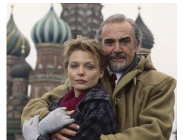
1990 LA MAISON RUSSIE (The Russia House) de Fred Schepisi avec Sean Connery