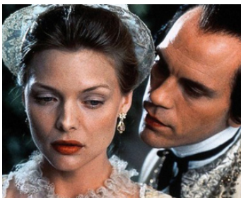
1988 LES LIAISONS DANGEREUSES (Dangerous Liaisons) de Stephen Frears avec John Malkovich