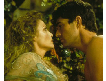
1999 LE SONGE D'UNE NUIT D'ÉTÉ (A Midsummer Night's Dream) de M. Hoffman avec Rupert Everett