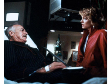
1985 SÉRIE NOIRE POUR UNE NUIT BLANCHE (Into the Night) de John Landis avec R. Farnworth