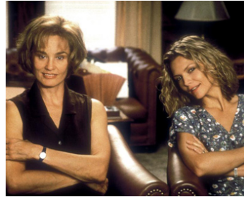
1997 SECRETS (A Thousand Acres) de Jocelyn Moorhouse avec Jessica Lange