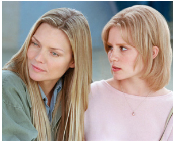
2002 LAURIER BLANC (White Oleander) de Peter Kosminsky avec Alison Lohman