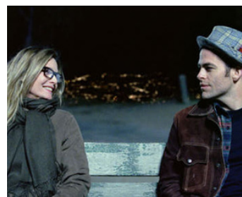
2012 DES GENS COMME NOUS (People like us) d' Alex Kurtzman avec Chris Pine