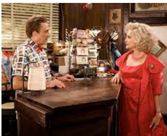
2007 HAIRSPRAY (Hairspray) d' Adam Shankman avec Christopher Walken