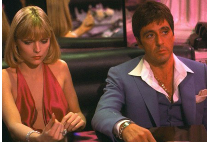
1983 SCARFACE (Scarface) de Brian De Palma avec Al Pacino