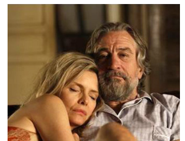
2013 MALAVITA (Malavita) de Luc Besson avec Robert De Niro