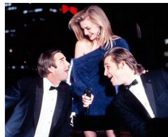
1989 SUSIE ET LES BAKER BOYS (The Fabulous Baker Boys) de S. Klovess avec B & J. Bridges