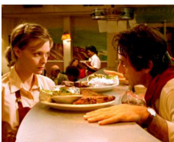
1991 FRANKIE ET JOHNNY (Frankie and Johnny) de Garry Marshall avec Al Pacino