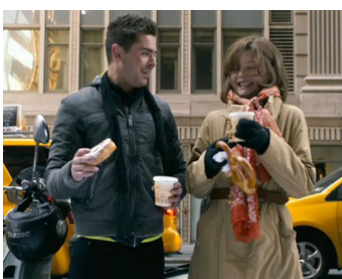
2011 HAPPY NEW YEAR (New Year's Eve) de Garry Marshall avec Zac Efron