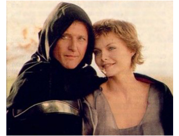
1985 LADYHAWKE, LA FEMME DE LA NUIT (Ladyhawke) de R. Donner avec Rutger Hauer